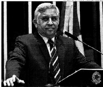
Izalci diz que Corte tem se afastado de sua função primordial

inquérito que deveria seguir o rigor da lei em uma mera petição, tudo para manter o controle absoluto das investigações que convenientemente o favorecem. É o melhor dos dois mundos para ele. Investiga quem bem entender sem prestar contas aos limites do Código de Processo Penal. Essa jogada, além de escancarar o autoritarismo disfarçado de zelo pela justiça, coloca em risco a própria integridade do sistema jurídico". (Agência Senado).